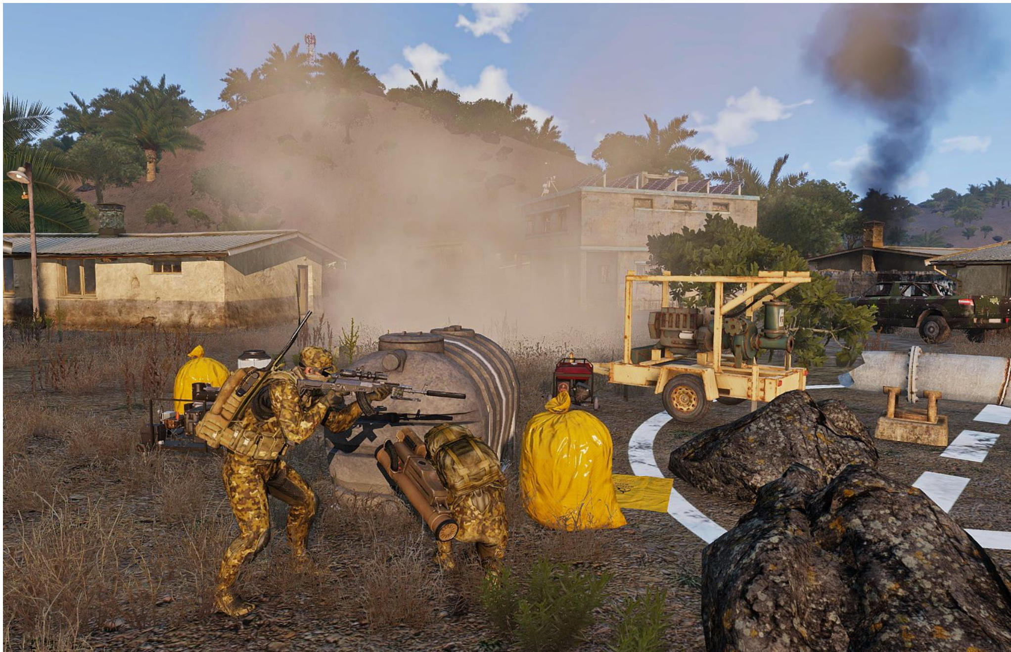
Dopo che il fuoco di Viper Red ha neutralizzato gran parte dei nemici al sito 9, Baciamattoni TL e Ilproxi minano il pozzo con i contaminanti chimici dell'Esercito del Mali, un attimo prima dell'arrivo dei separatisti Tuareg