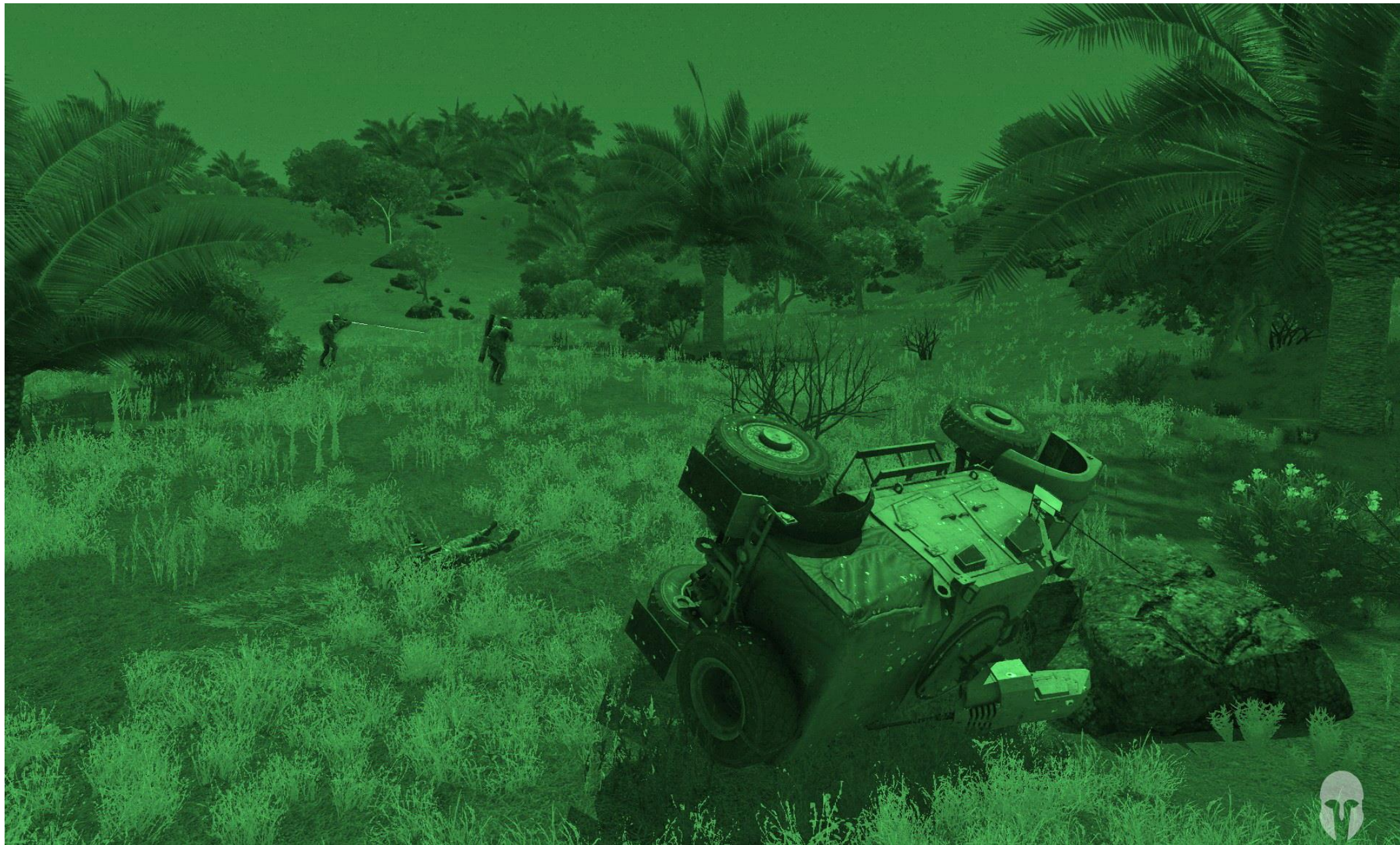
Opponentsilver e Darckan passano vicino ad un MRAP Hunter dell'Esercito del Mali, neutralizzato con una combinazione di granate e raffiche di mitragliatrice Navid e poi ribaltatosi