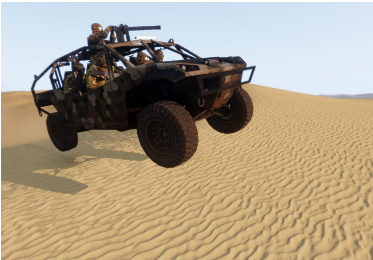
Quilin LSV in rapido movimento sulle dune