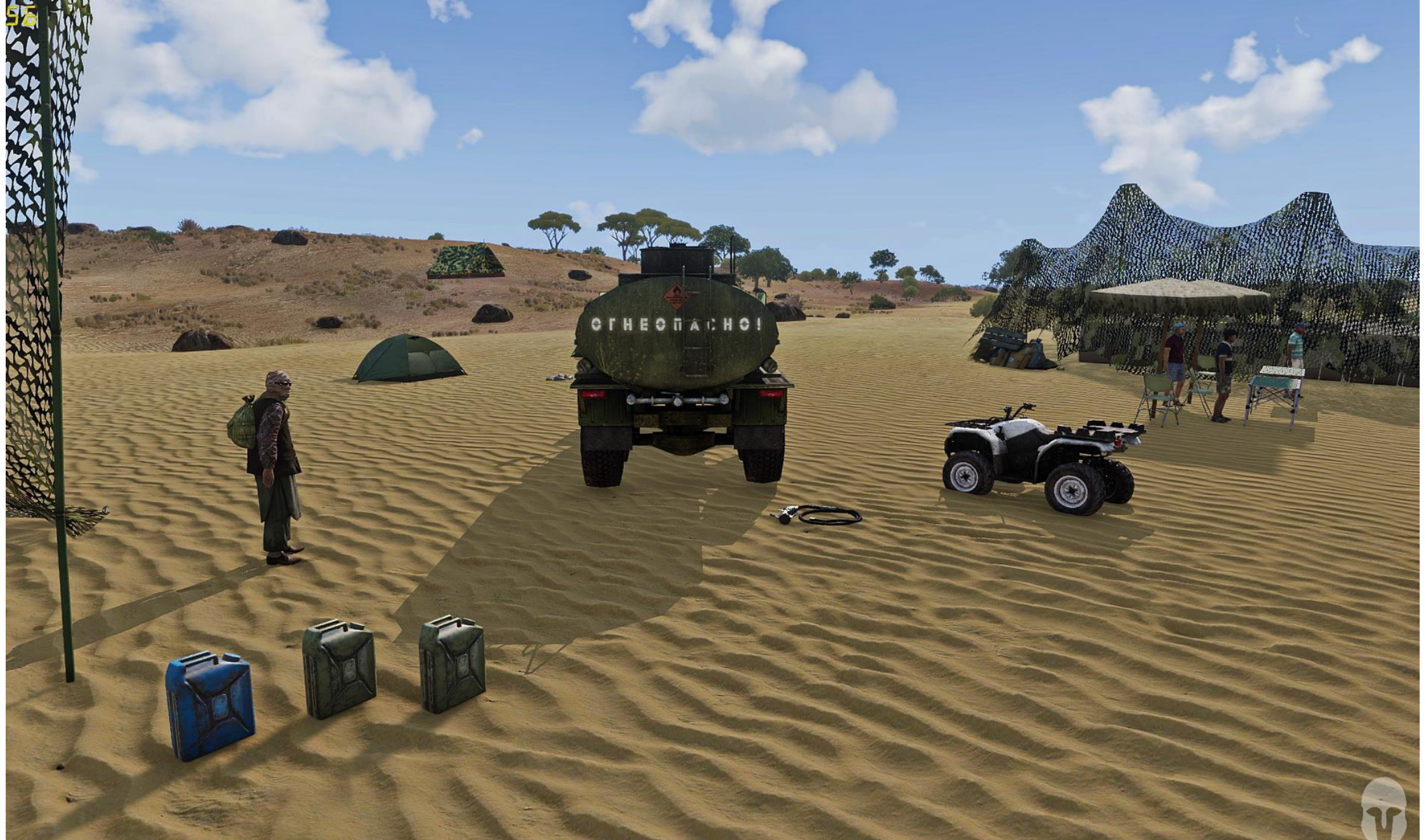
MisterT, con raffinato travestimento da beduino, si aggira disinvolto nella stazione di rifornimento dei miliziani del Nord del Mali, segnalando le unità nemiche ai Viper Red