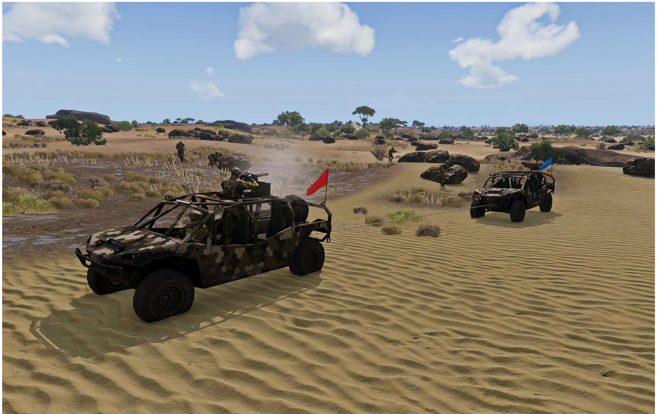
Il veicolo danneggiato viene trainato da quello ancora funzionante, sul quale sale il grosso di Viper Red