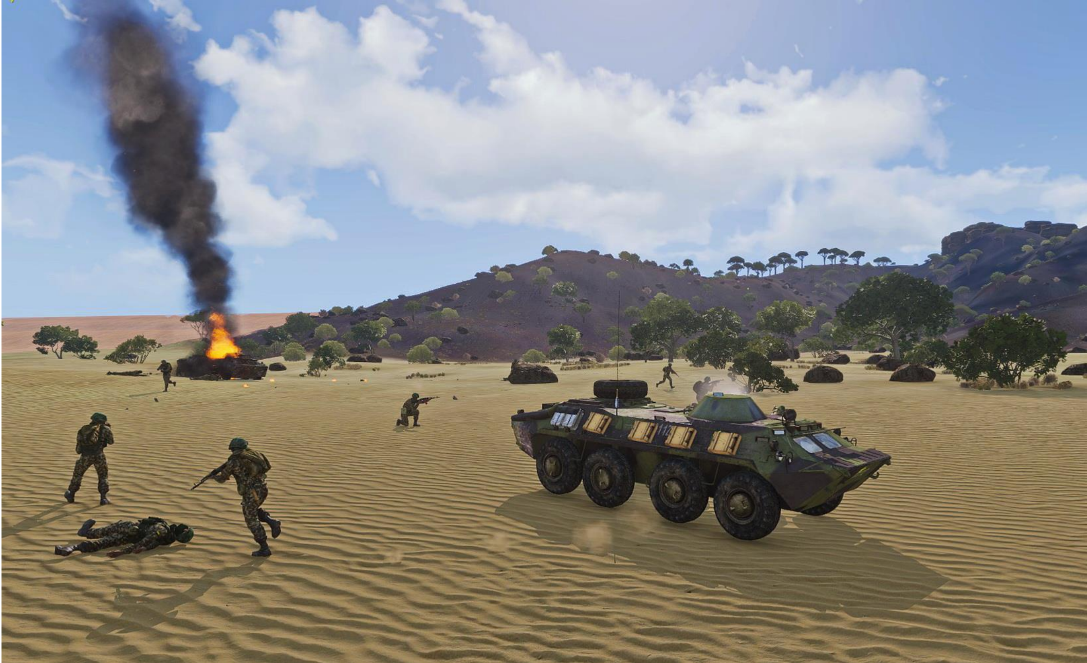
Il plotone di BTR-70 è colpito a sorpresa dagli RPG e dalle mitragliatrici Navid di Viper Red nascosto tra i pini e le rocce in cima alla montagna sullo sfondo