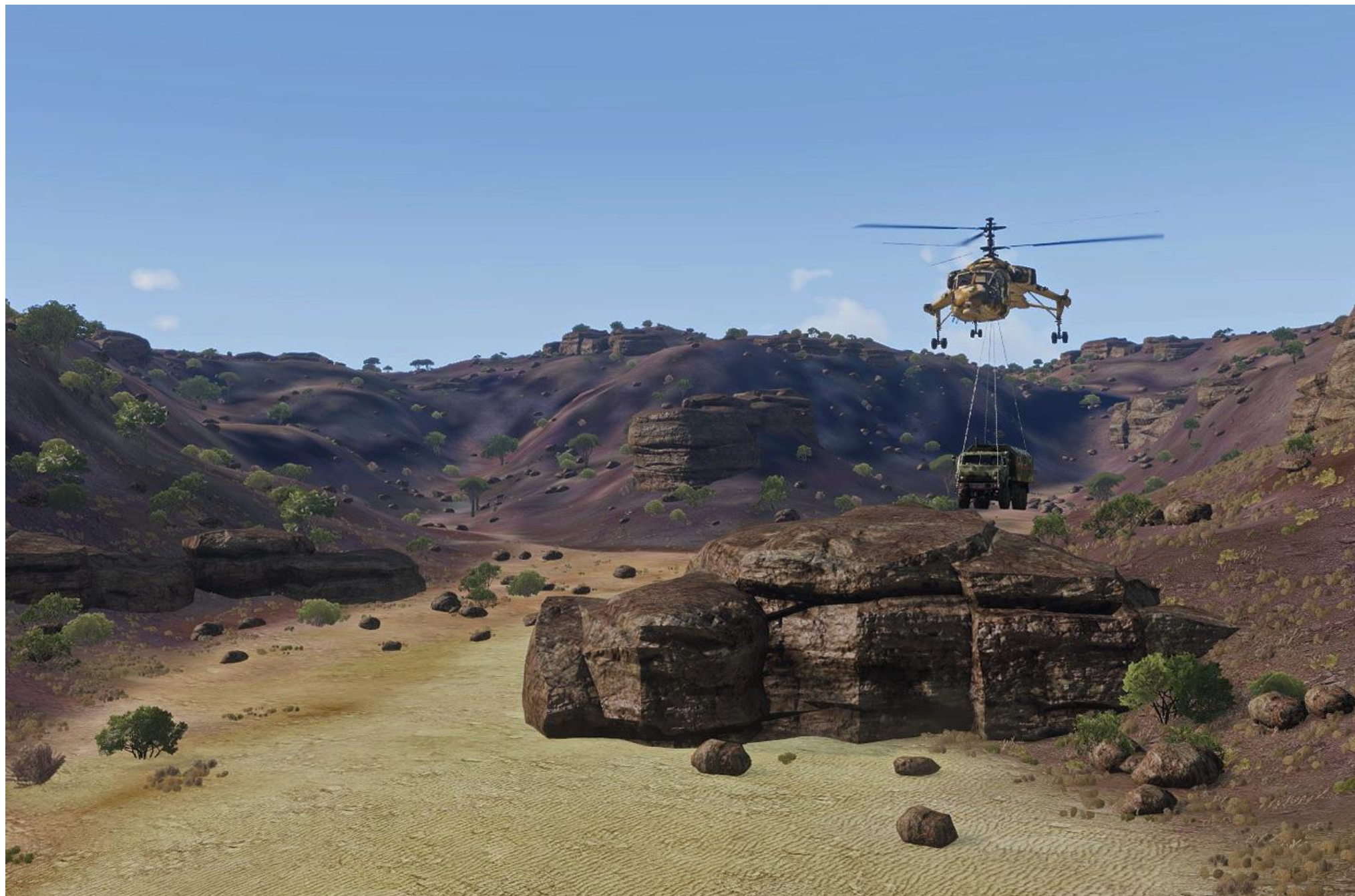
Dopo l'ultimo scontro un elicottero Taru porta via il camion con il materiale chimico sottratto all'esercito del Mali