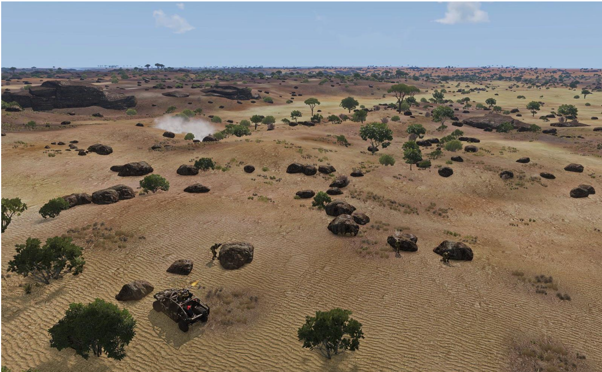
Xagrem, Oarion e Yuro, appoggiati da un Quilin LSV con Minigun bloccano la forza di reazione rapida nemica mentre il resto della squadra cerca di riparare l'altro veicolo