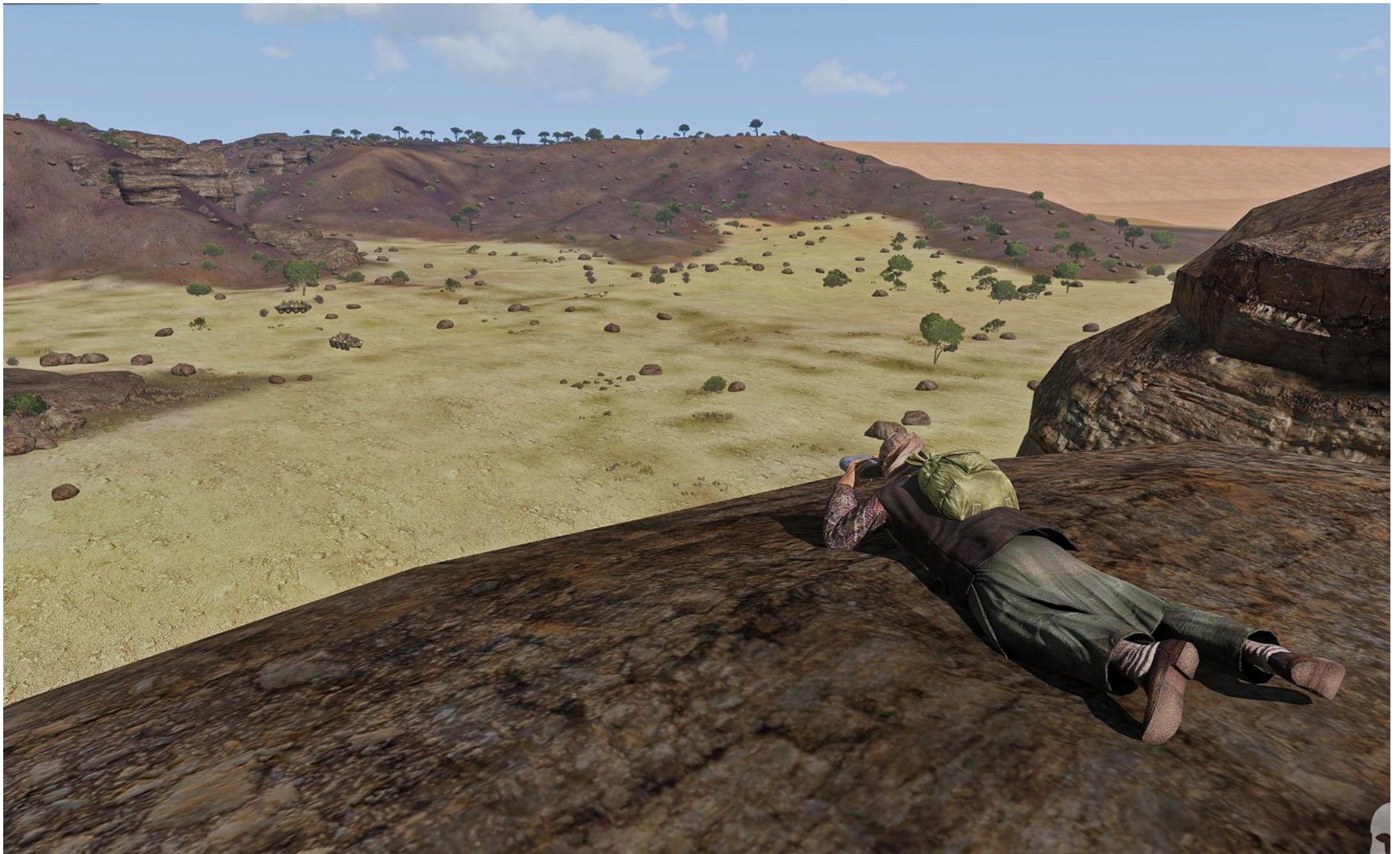
MisterT in abiti da beduino segnala a Viper Red i BTR-70 nella valle dove deve avvenire l'estrazione con gli elicotteri Taru