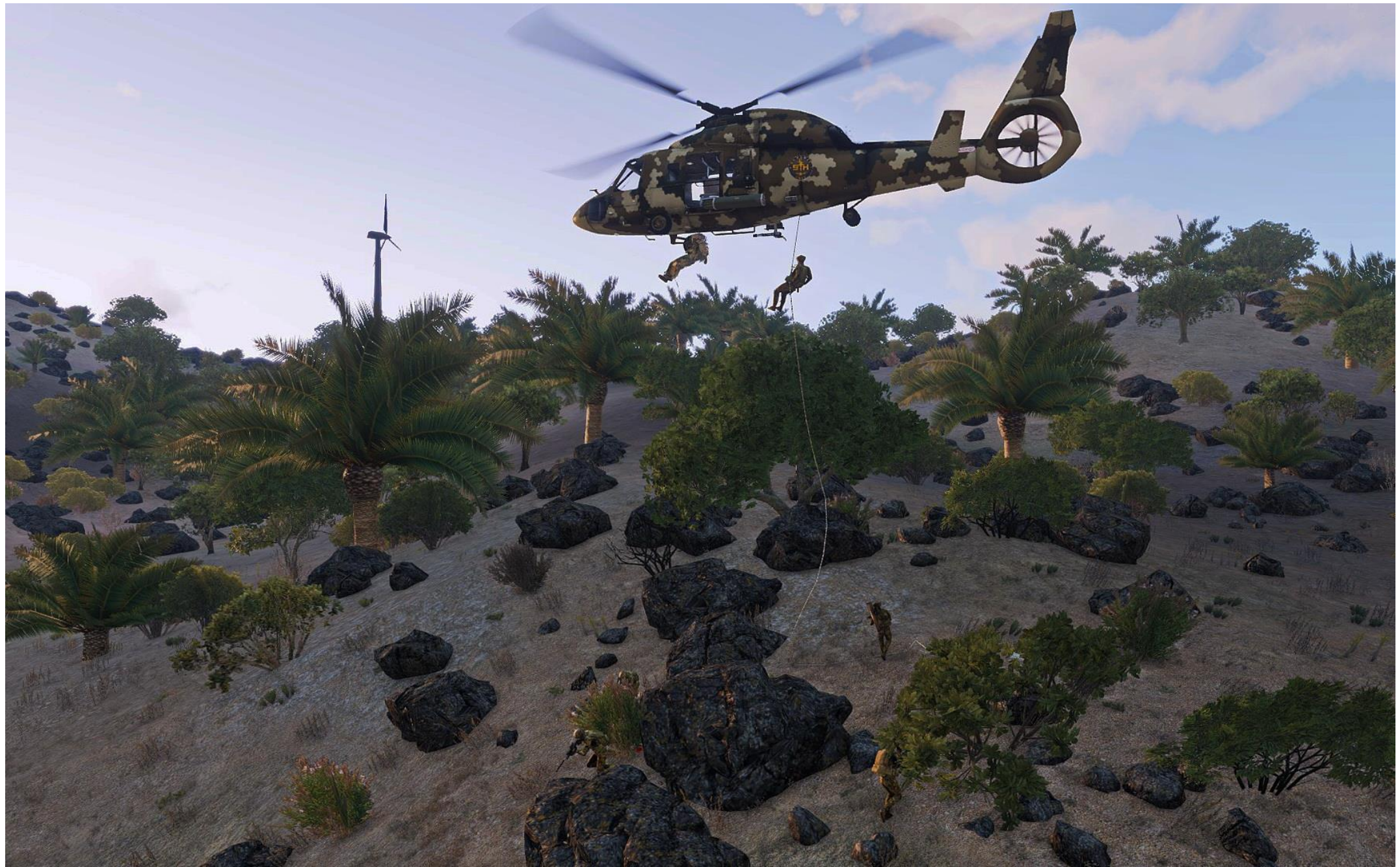
Nebel Nexus su Ka-62 deposita Viper Red in rappelling sotto le montagne con gli impianti eolici del Green Great Wall