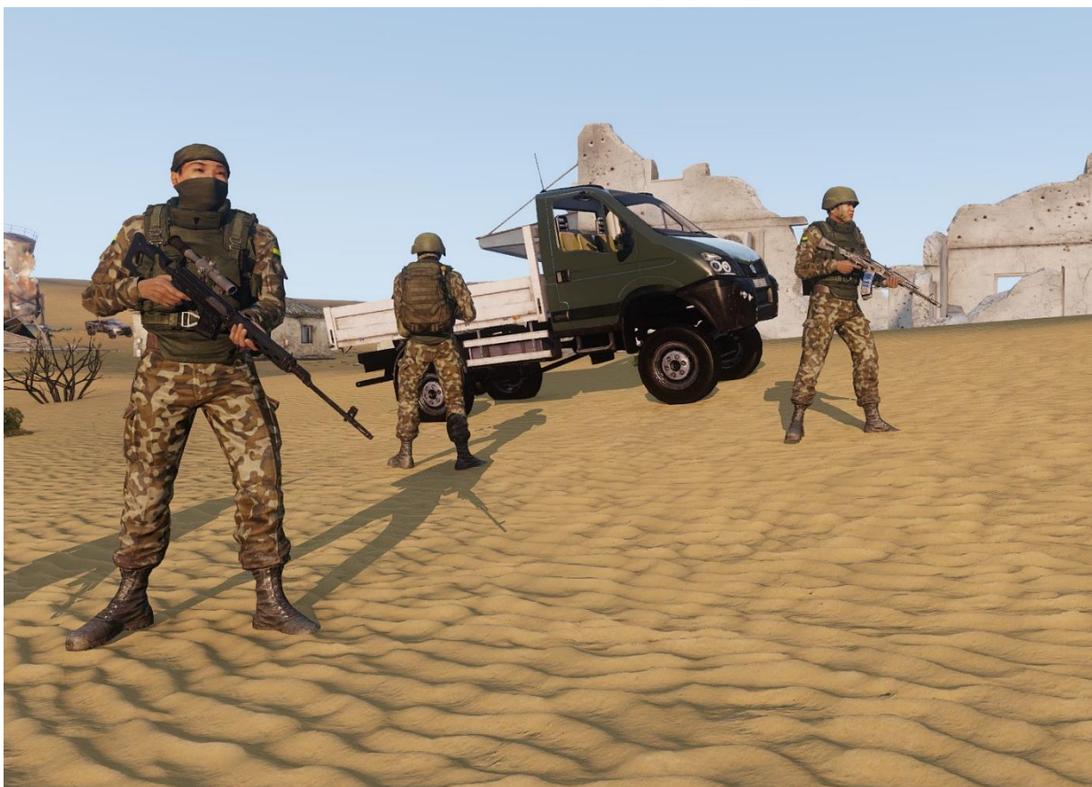
Unità motorizzate dell'Esercito Regolare del Mali