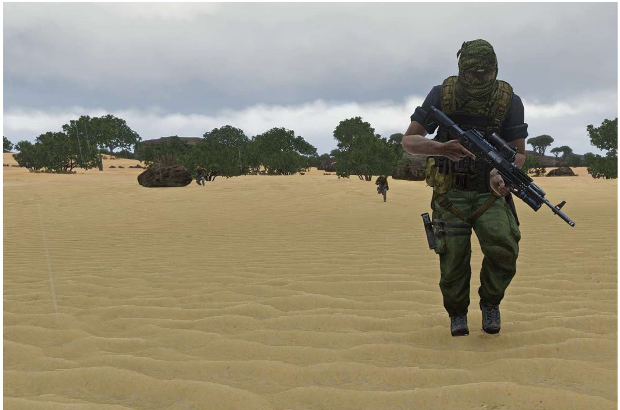
Xagrem TL dà l'esempio, guidando Duken e Nibbio verso i miliziani del Nord del Mali, coperto dall'MG di MisterT