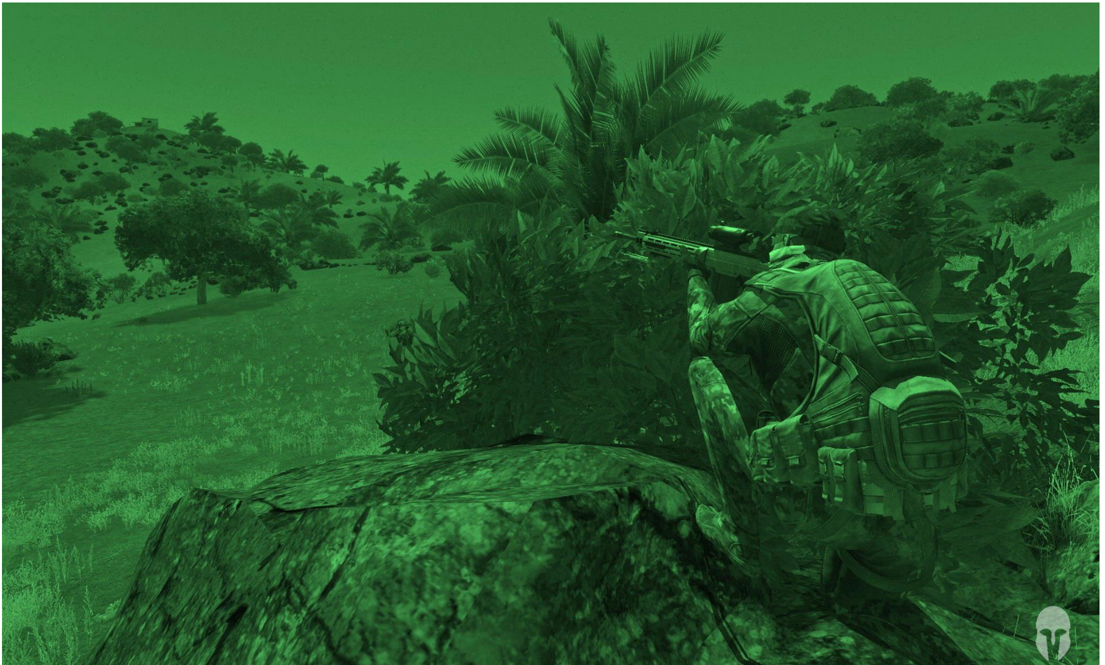
Batambra spiega ai soldati del Mali che non devono mettere fuori la testa, mentre il resto di Viper Red completa gli interventi presso il drone precipitato