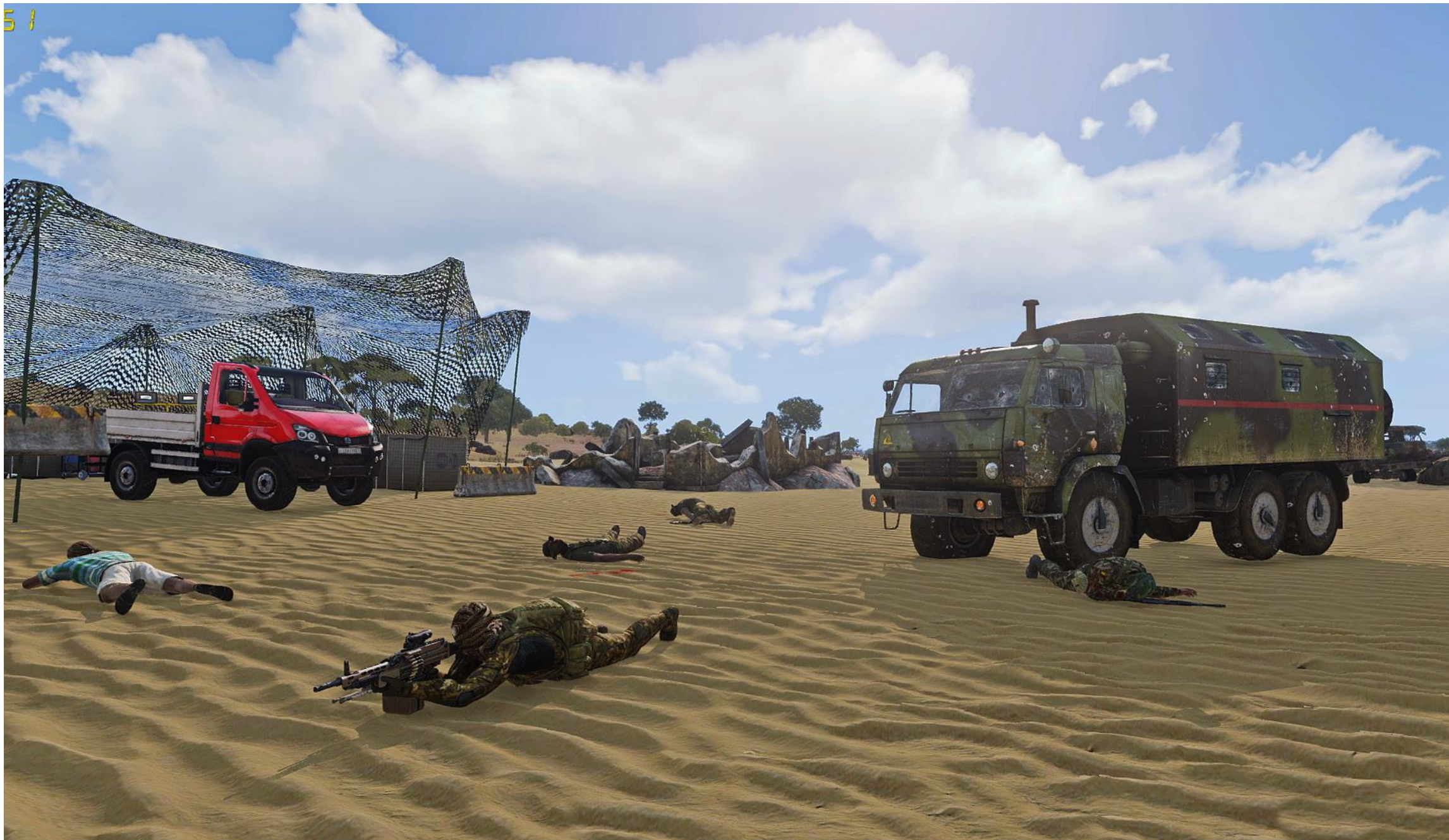
Dopo un feroce scontro a fuoco con la scorta, Viper Red preleva il camion con il materiale chimico, coperta da Wildride