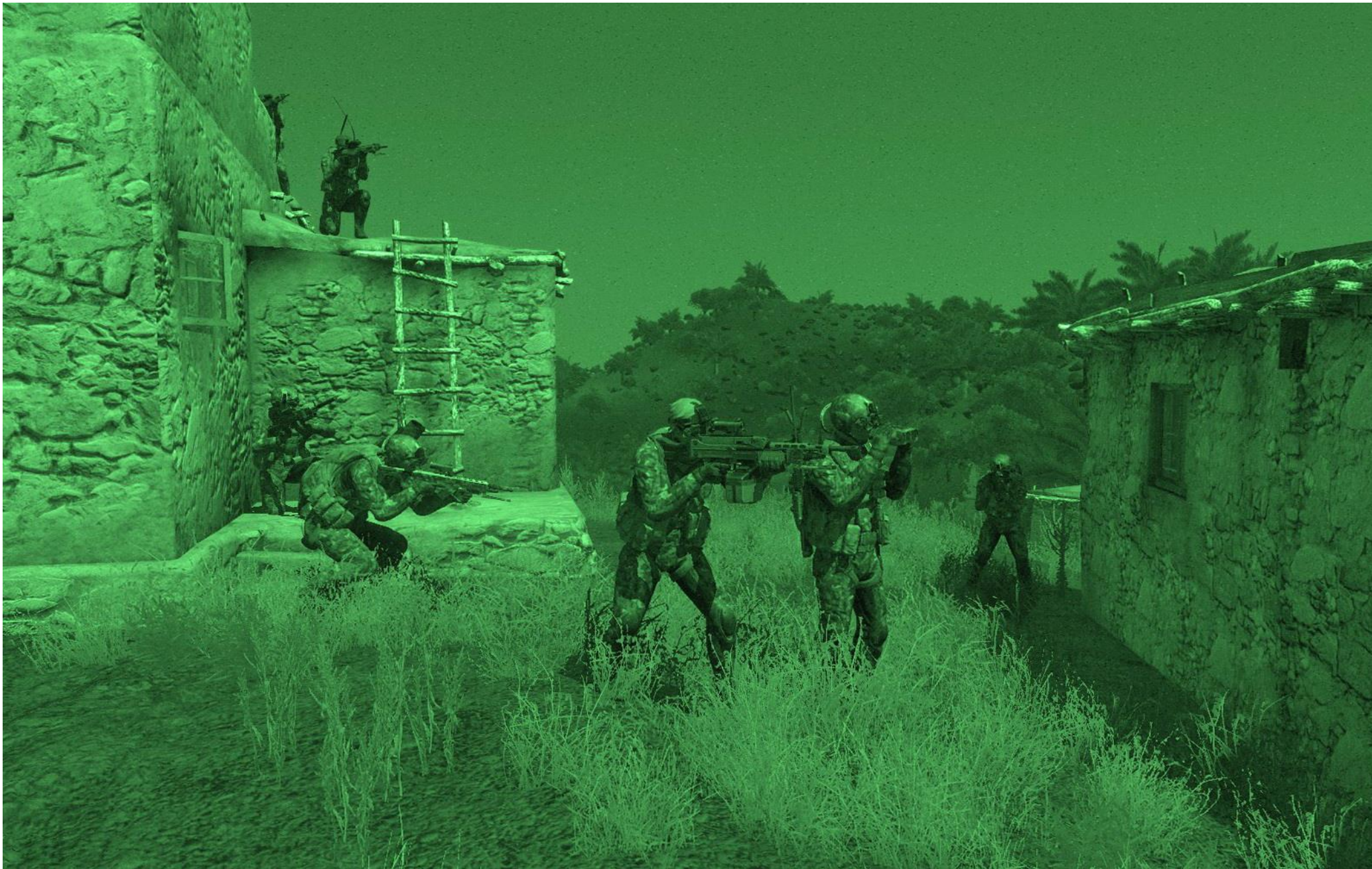
Viper Red si riorganizza coperta da Batambra e Cry TL sul tetto, prima dell'attacco al minareto dal quale provengono le emissioni di controllo dei droni rilevate da Mastersweep con l'antenna ESM