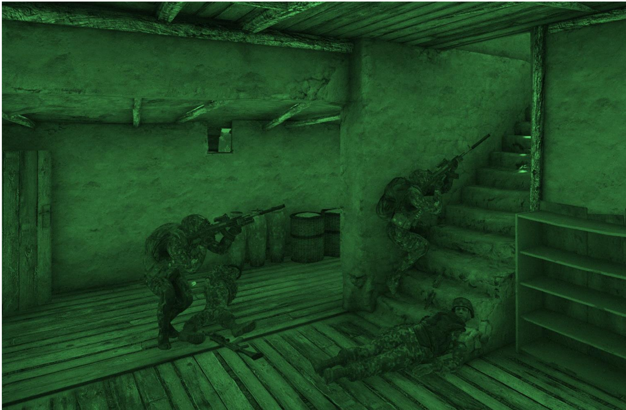
Mastersweep e Darckan controllano uno degli edifici attorno al minareto dopo aver neutralizzato i soldati nemici sulla porta