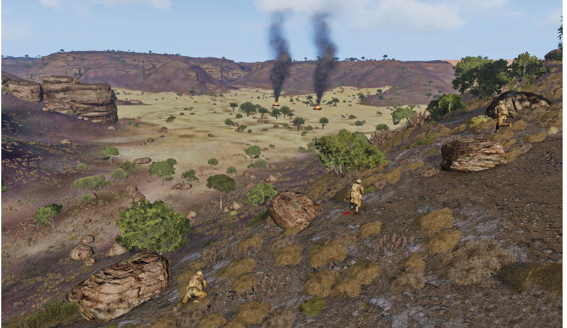
Dopo aver distrutto i BTR-70 con tiri precisi degli RPG, Viper Red si avvicina per eliminare i sopravvissuti nascosti tra le rocce e i mezzi fuori combattimento