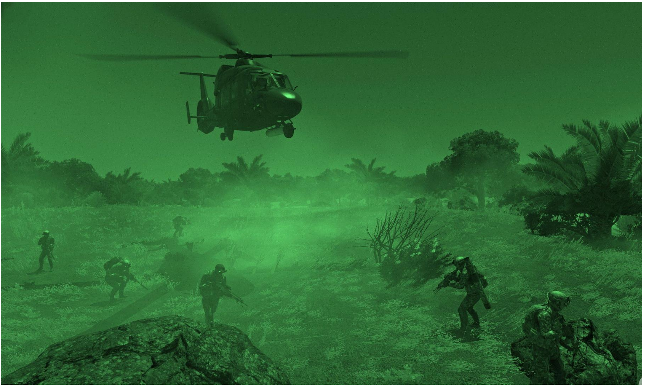
Il Ka-62 pilotato dal IlProxi deposita Viper Red a terra dopo un volo notturno a bassissima quota nelle vallate per sfuggire alla scoperta dei radar del Mali