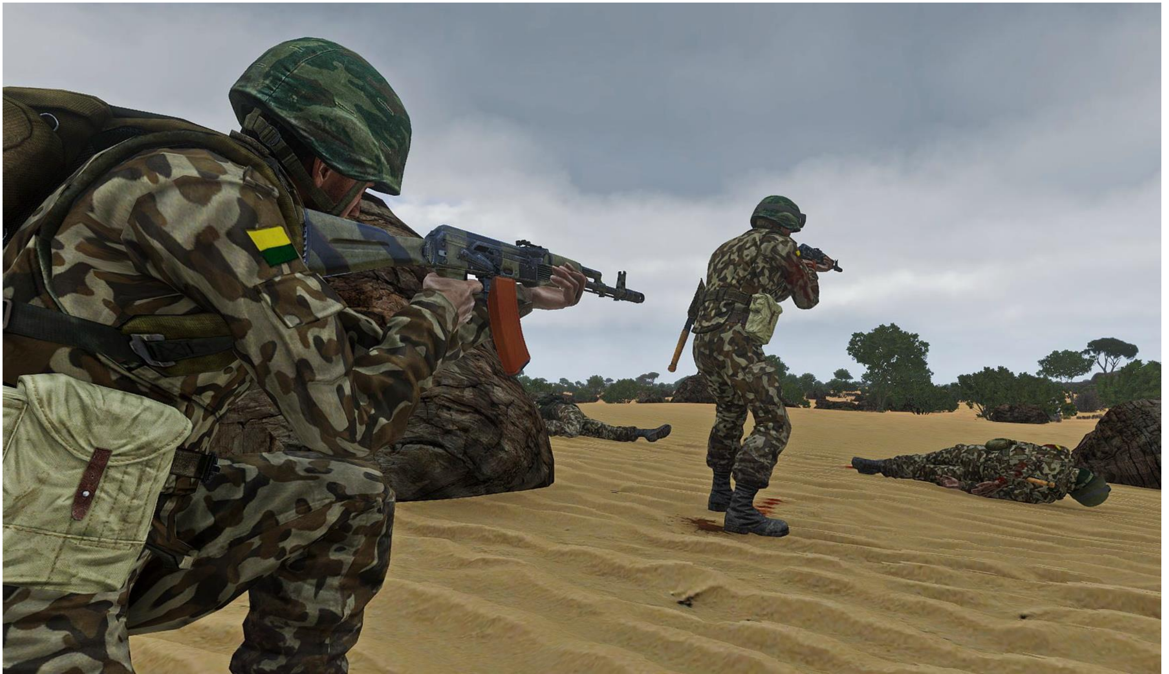
Una pattuglia dell'esercito regolare del Mali tenta una manovra di aggiramento su Viper Red, che viene neutralizzata grazie alla sorveglianza dello UAV