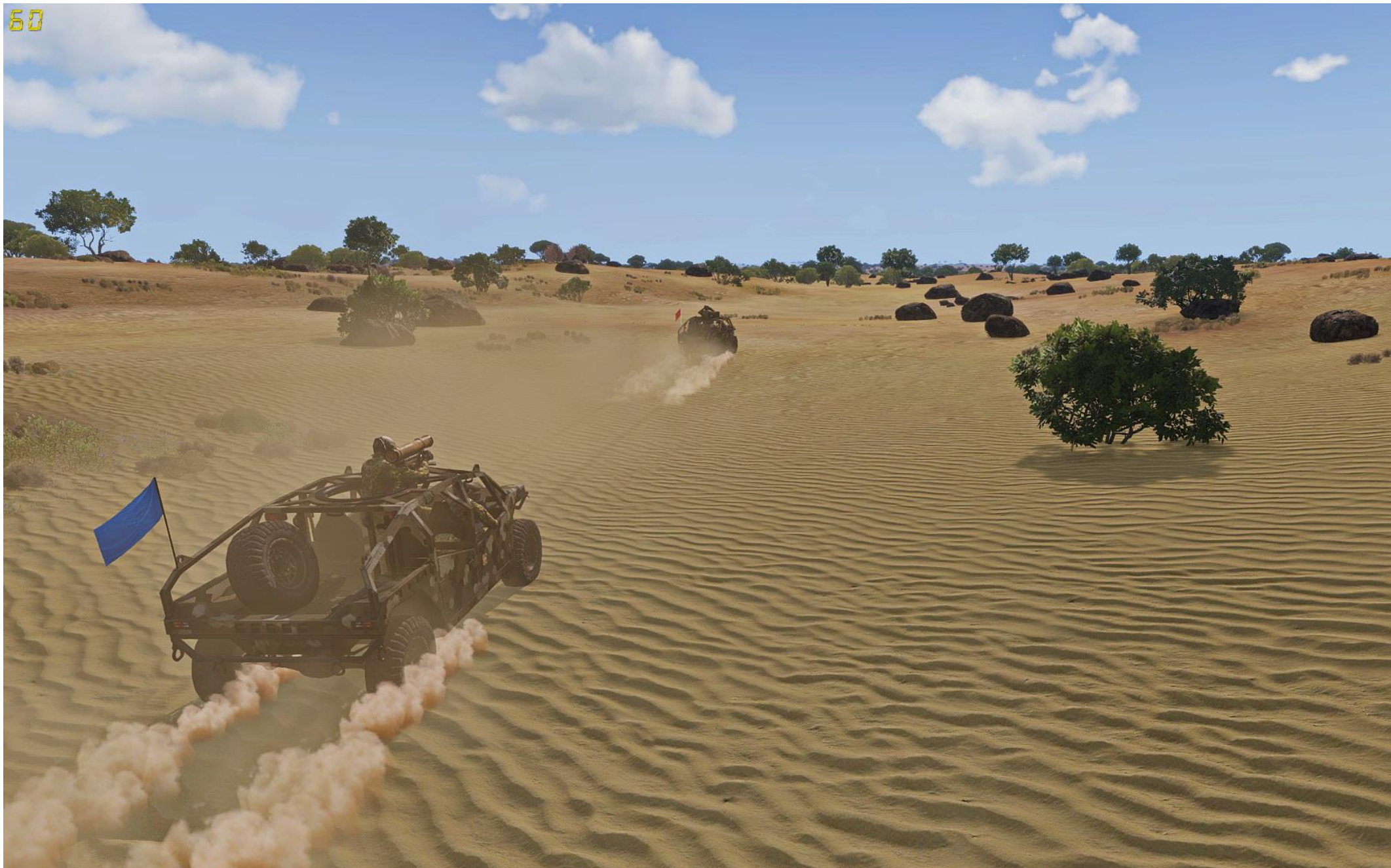
Viper Red si muove verso la stazione di servizio nel deserto su 2 Quilin LSV. L'informatore MisterT è già arrivato sul posto con il suo quad