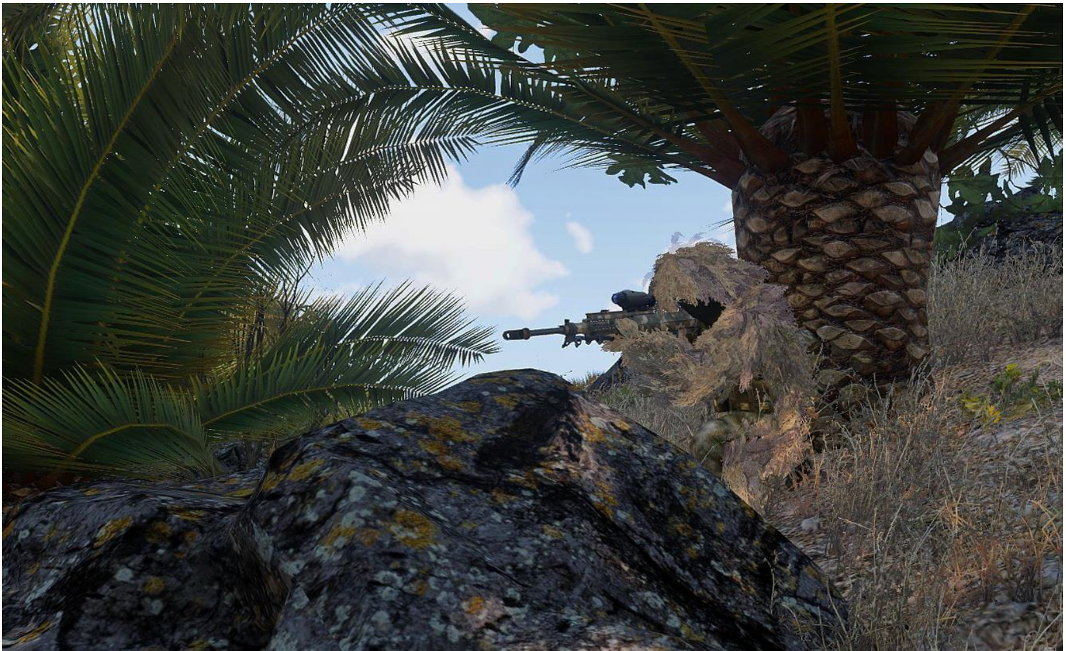
Ubik copre Viper Red che avanza verso il sito 9 del Great Green Wall, pronto a colpire le sentinelle nemiche al momento dell'attacco