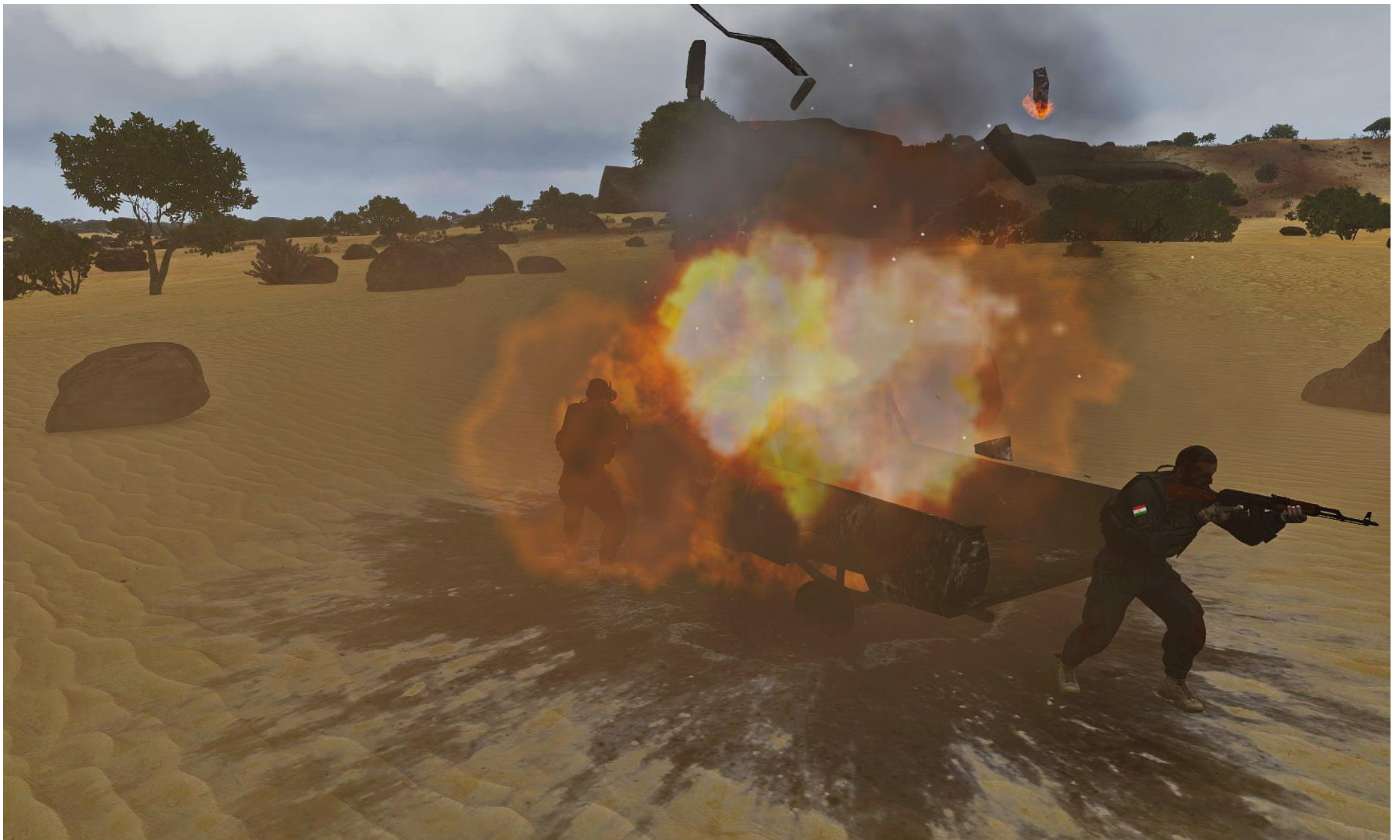
Un fuoristrada Nissan, giunto in supporto ai miliziani presso la casa del fratello dell'informatore, neutralizzato da un RPG di Duken