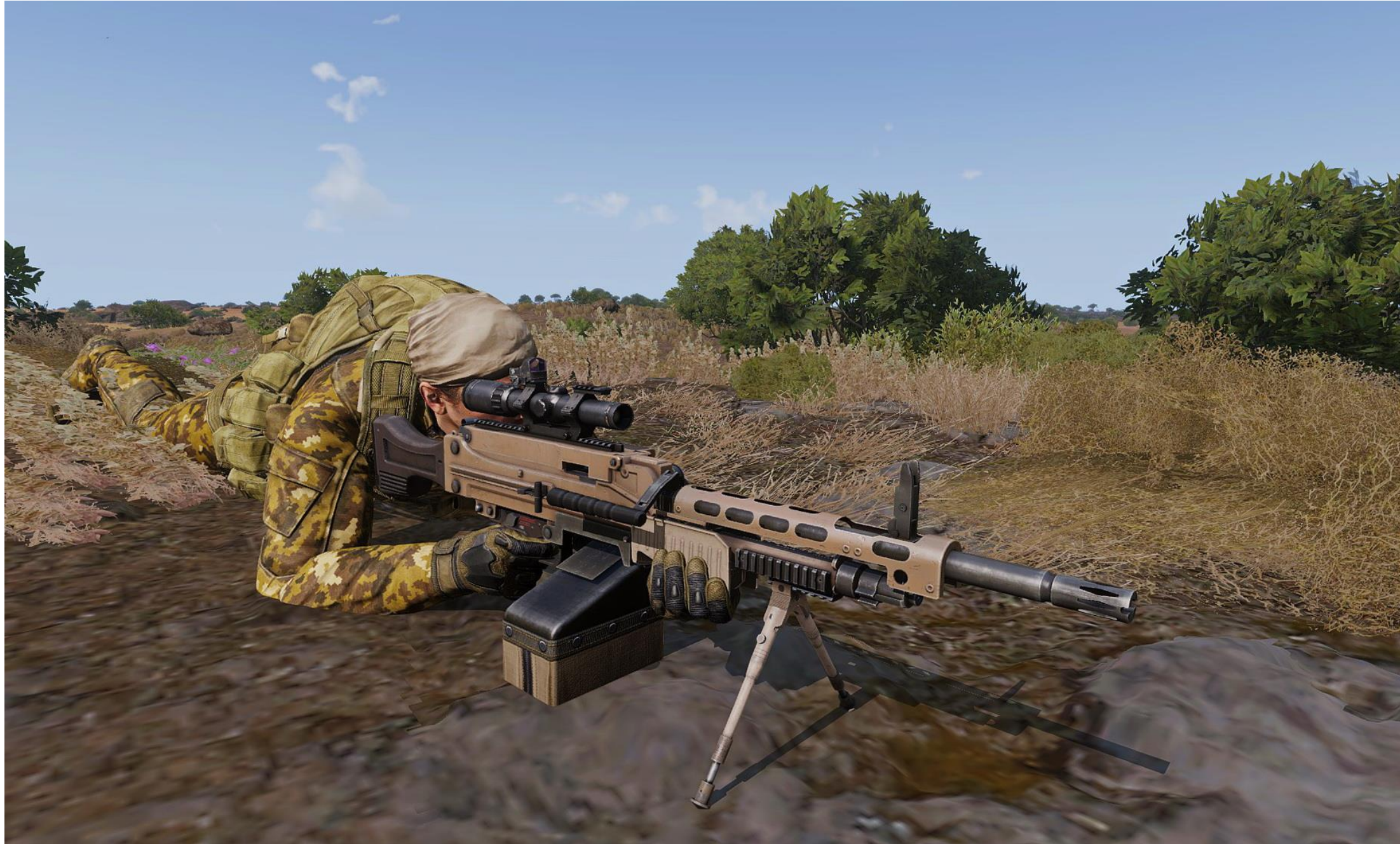
Deadpool pronto ad aprire il fuoco sulla stazione di servizio con la mitragliatrice media Navid 9,3 a circa 400 metri di distanza