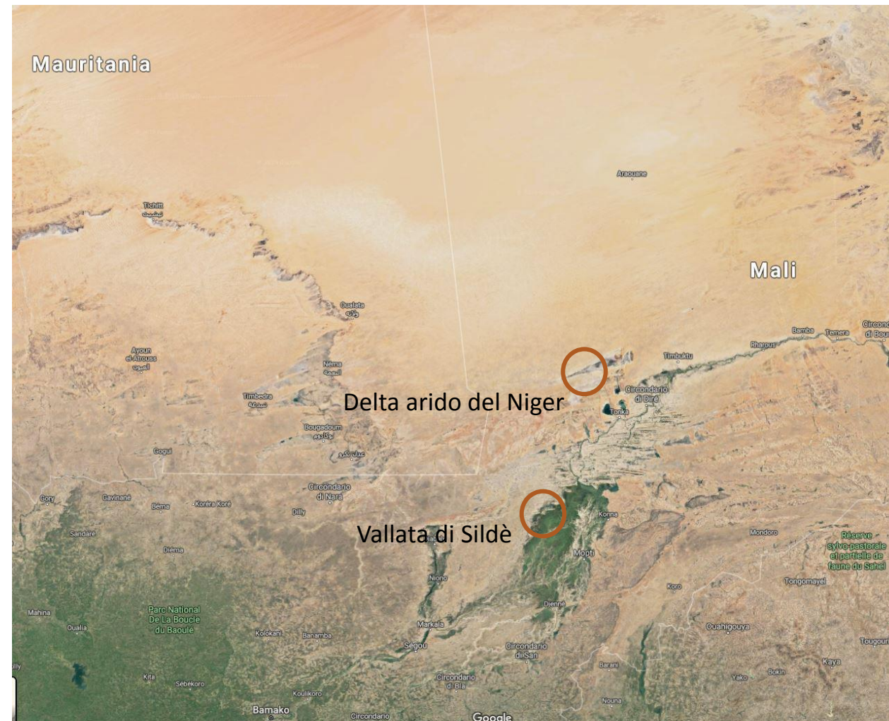
Il deserto del Sahara occidentale ed i luoghi della campagna

Nel deserto del Nord del Mali , nell'area del Delta del Niger , ormai in gran parte in secca a causa dei cambiamenti climatici, sono stati scoperti giacimenti di uranio, oro e cobalto. In questi luoghi è molto attivo un movimento separatista Tuareg ostile al governo centrale del Mali , il quale invece intende consolidare il controllo sull'area, utilizzando le efferate Milizie del Nord del Mali come strumento di controllo e repressione. Il CSAT invia pertanto nelle sue basi avanzate nell'Est della Mauritania alcune unità di forze speciali Viper con appoggio limitato, con lo scopo ostacolare e mettere in imbarazzo il governo del Mali, costringendolo a fare concessioni ai separatisti. In questo modo i Tuareg dovrebbero mantenere il controllo dell'area e sviluppare un accordo con il CSAT per lo sfruttamento delle risorse in cambio di protezione.