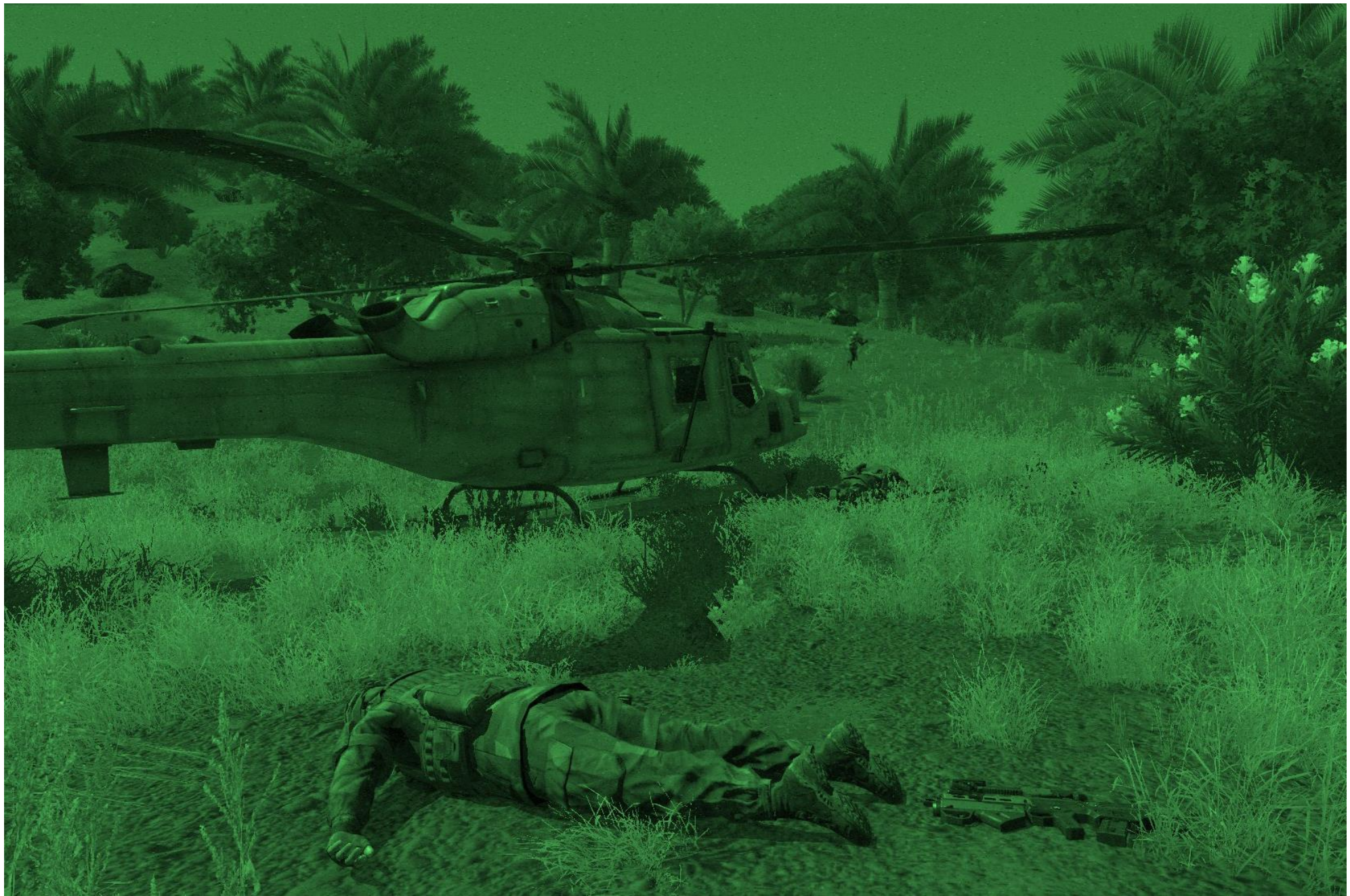
La brutta fine delle Forze Speciali Francesi intervenute per prendere in consegna una parte del materiale del drone CSAT in mano all'esercito del Mali