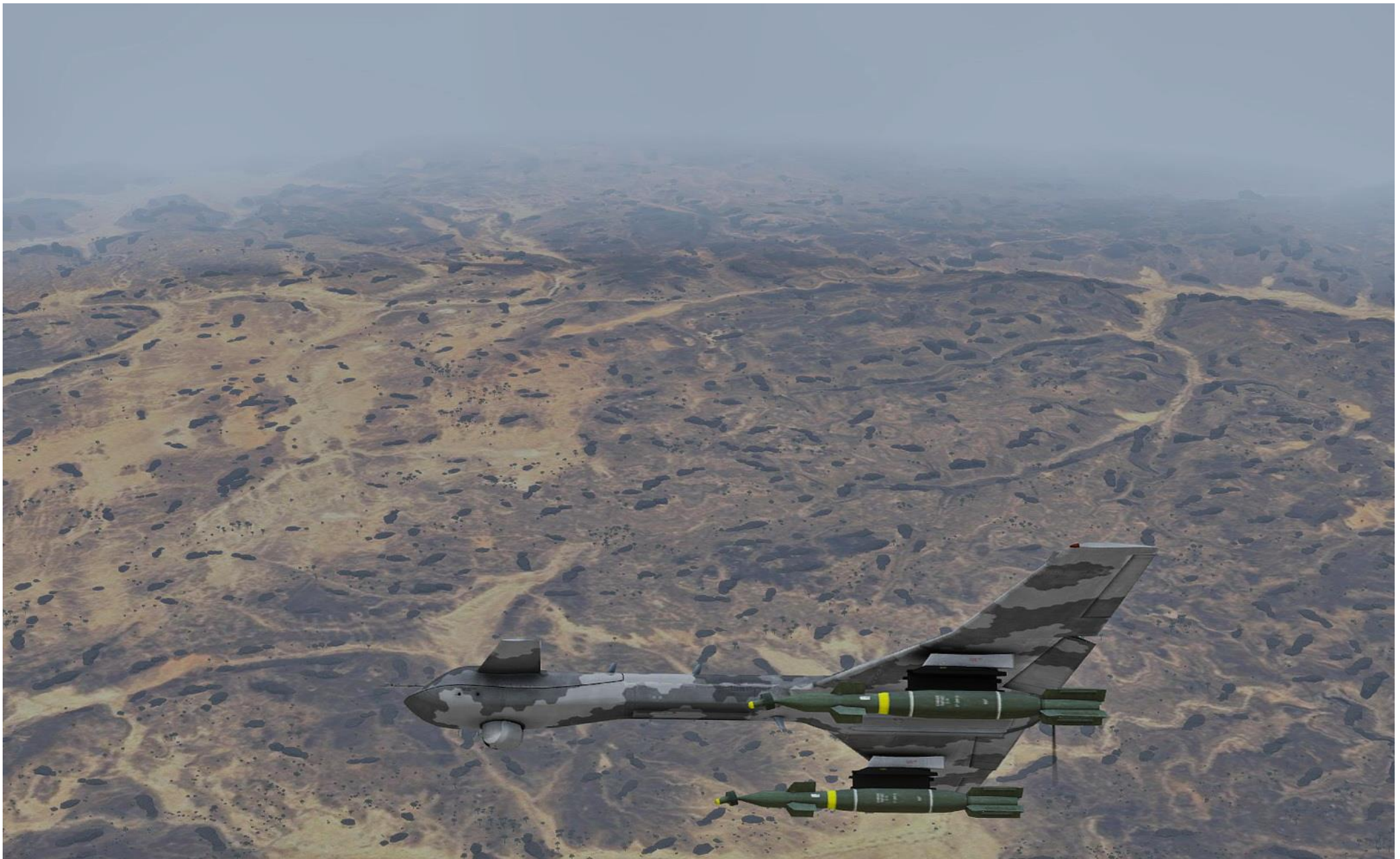
Uno UAV Ababil sorveglia il campo minerario abbandonato dove è stato portato l'informatore passando le informazioni a Viper Red. Il meteo avverso ha reso difficile l'impiego delle bombe a guida laser