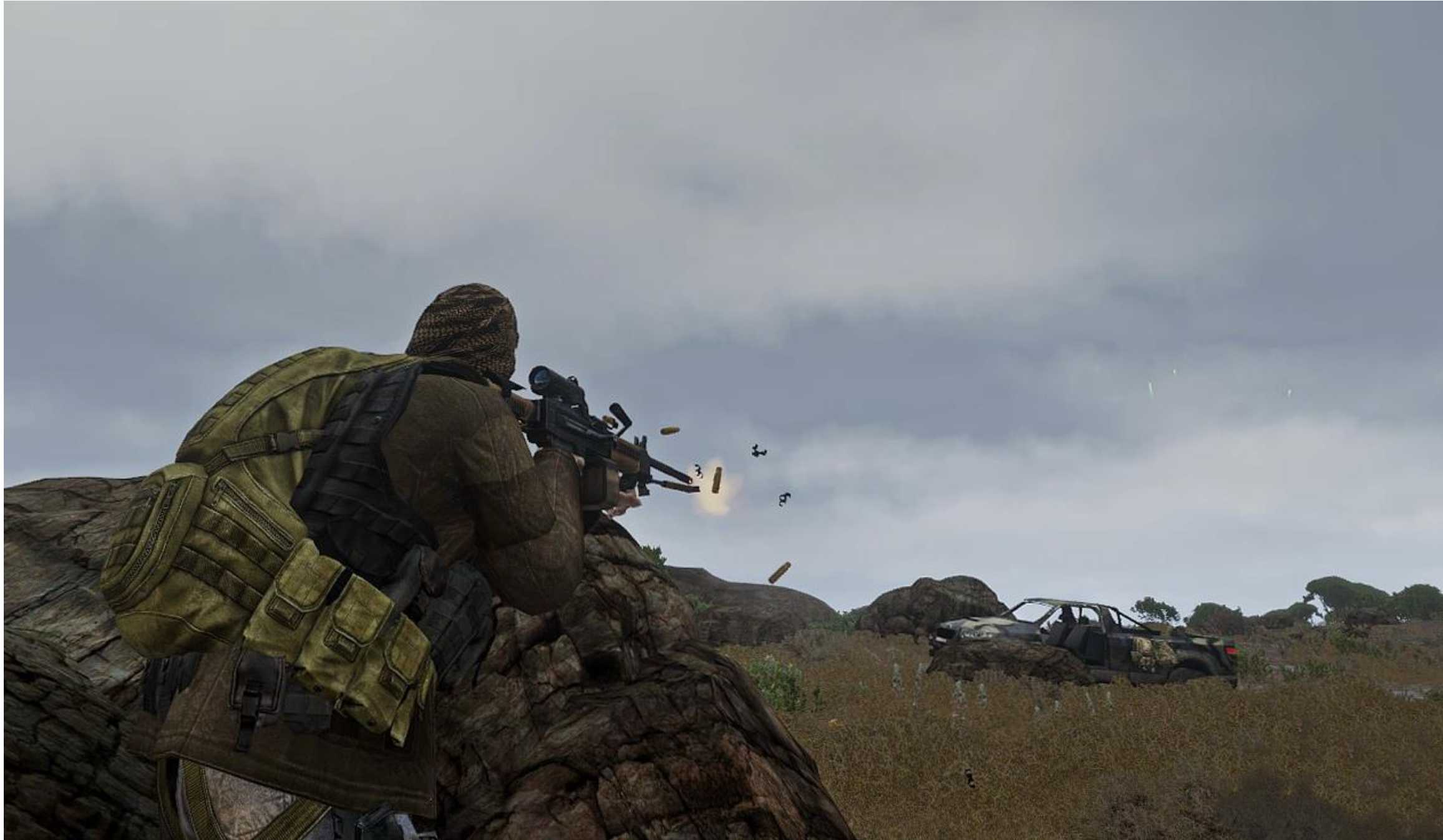
Dopo aver recuperato l'informatore ed essersi allontanata, Viper Red tende un'imboscata ad un veicolo inseguitore, neutralizzato dall'MG di MisterT