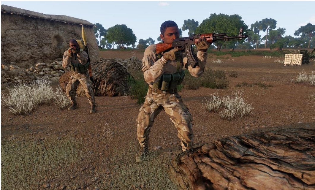
Milizie del colonnello Mbembe (varie mimetiche, armi spesso ex-sovietiche)

Le fazioni coinvolte nella campagna sono: