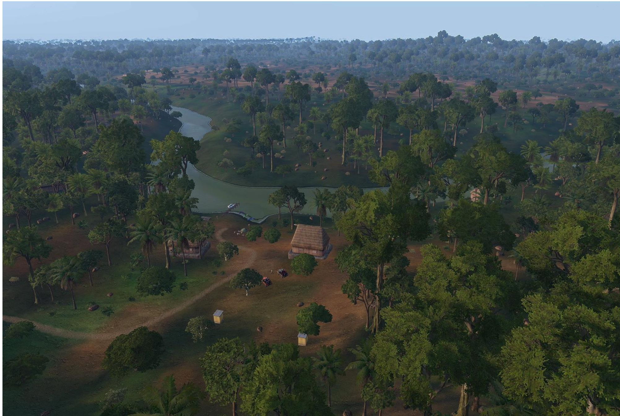
Il lodge Konkamoya sul fiume Limpopo circondato dalla vegetazione. Al momento ha già una decina di ospiti, un paio di guide e personale di servizio