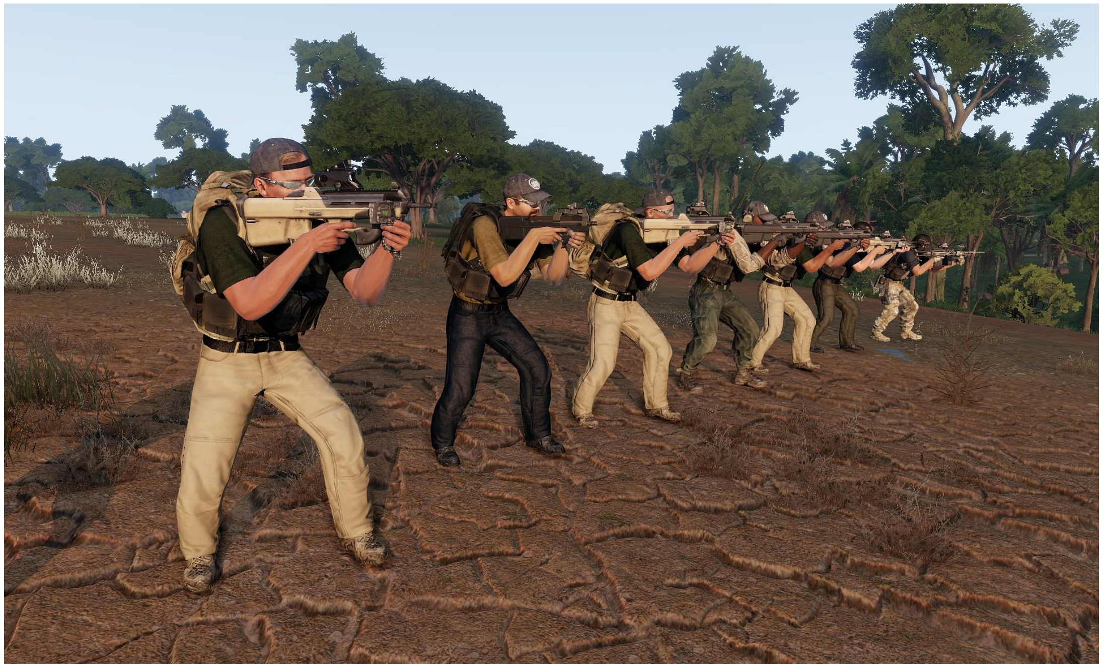
I Theseus PMC. Notate che non hanno uniformi standardizzate, ma fate caso all'equipaggiamento (vedere avanti). L'arma base è il bulpup F2000