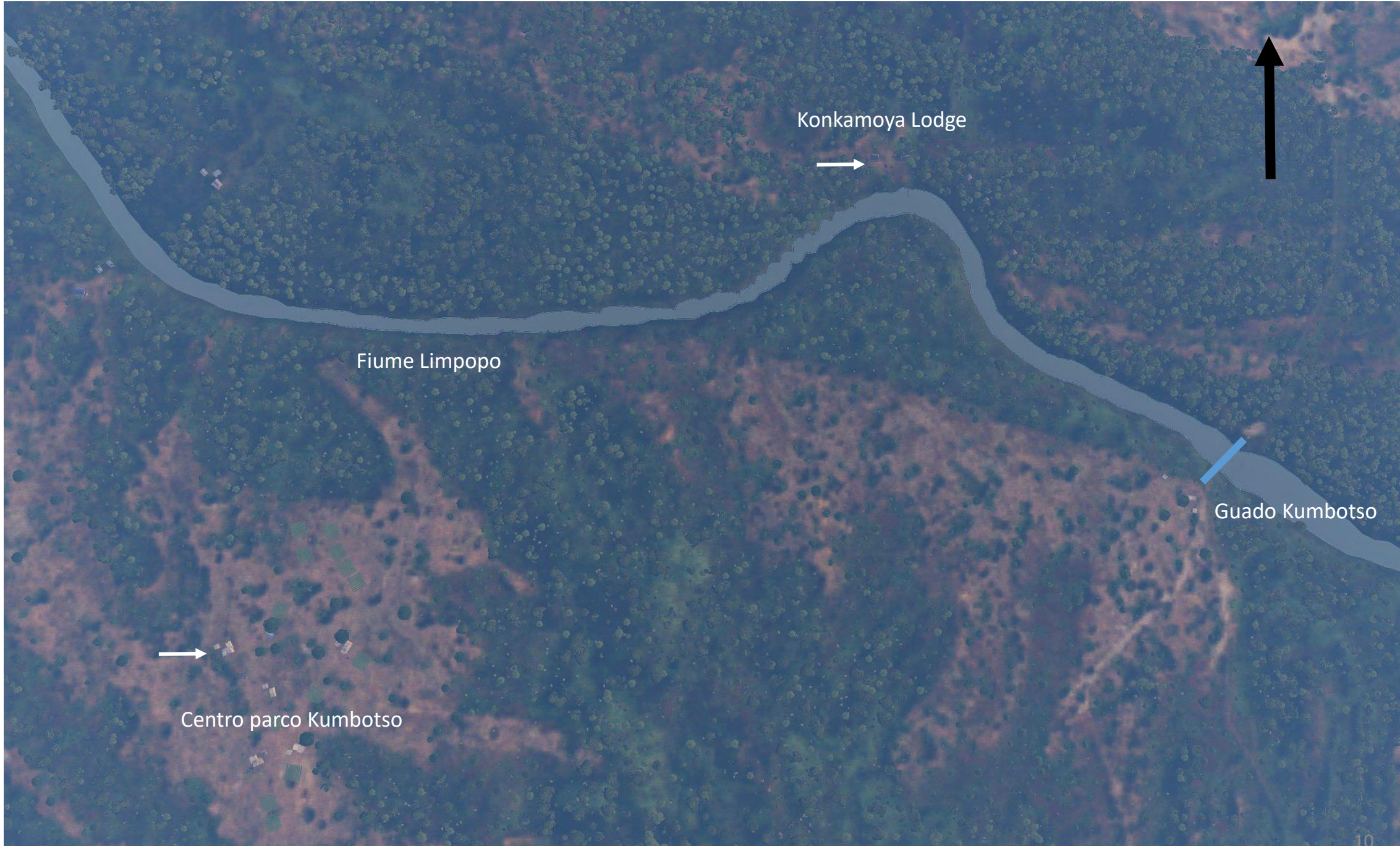
Dettaglio dell'area attorno al fiume Limpopo interessata dal pattugliamento. Il guado Kumbotso è l'unico punto attraversabile dai veicoli