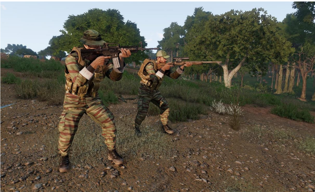
Ranger Wild Dogs (mimetica tiger stripes, armi americane)