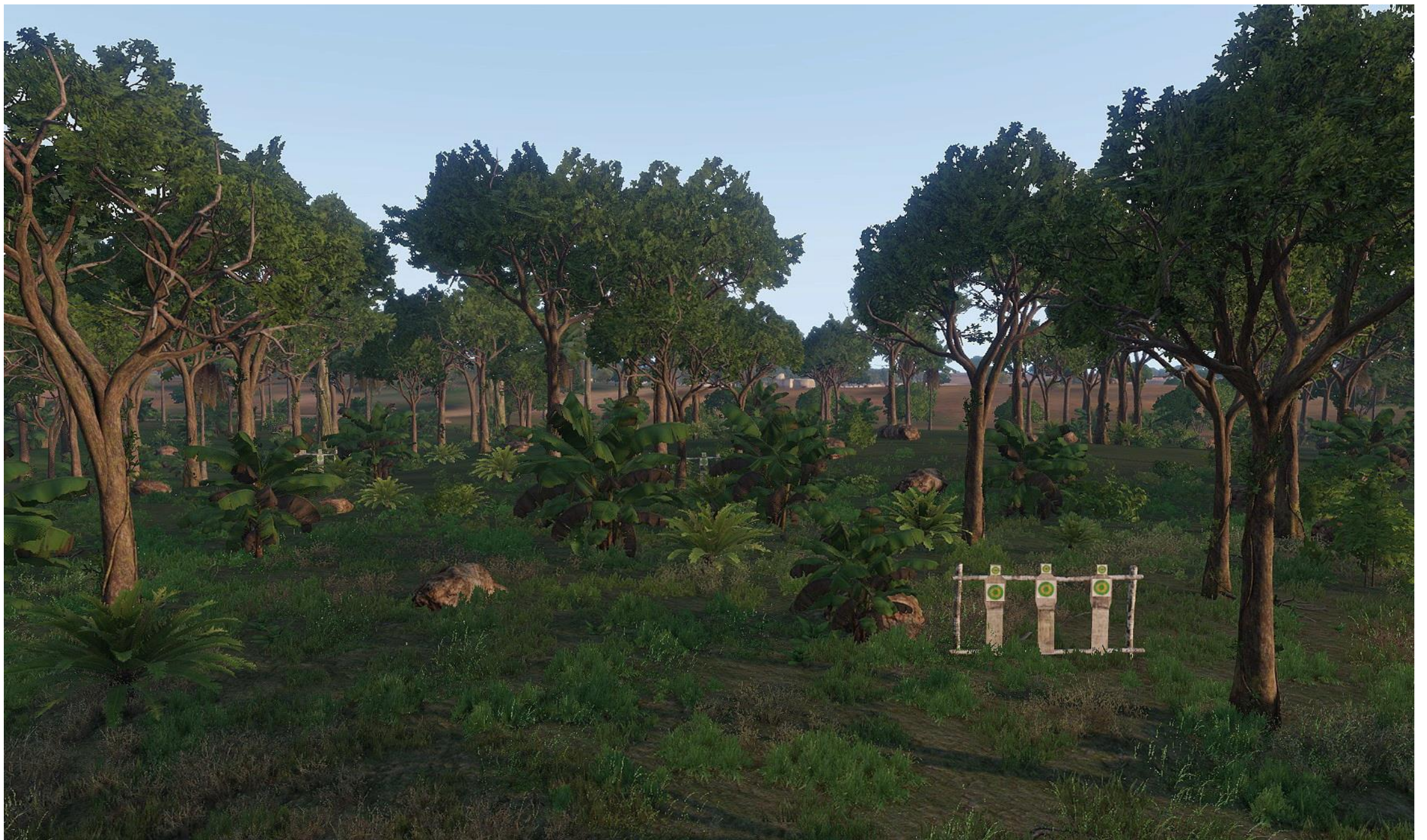
Poligono a Est di Camp Eland